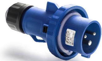
Ref. / Item 14200